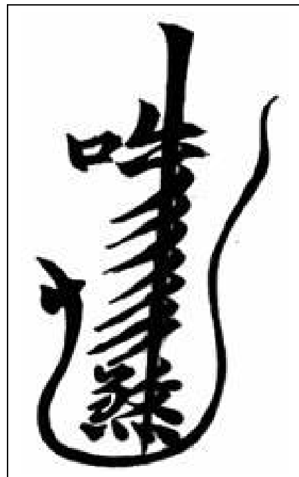
Diagrama I : Neutralizador

Es sumamente esencial evitar las pesadillas que cuelgan del techo (vigas y salientes) sobre todo cuando se ubican por encima de la cama, escritorio o sillón donde se suele permanecer varias horas, ya que son causas de tensiones que comprometen la serenidad y relajación. Si estas vigas cuelgan en lugar de tránsito no resulta tan perjudicial para los moradores. Para revertir esta situación es necesario revestir los tirantes preferentemente madera antes que chapa, plástico o telgopor, hasta es posible neutralizar estas pesadillas colgantes con telas que las cubran.